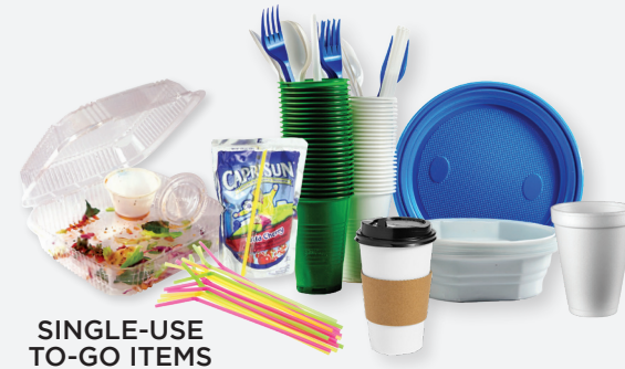
SINGLE-USE TO-GO ITEMS