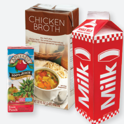
CARTONS & WAXED CARDBOARD