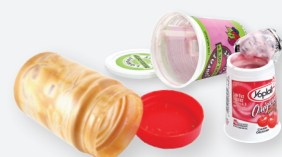
CONTENEDORES PLÁSTICOS PARA ALIMENTOS