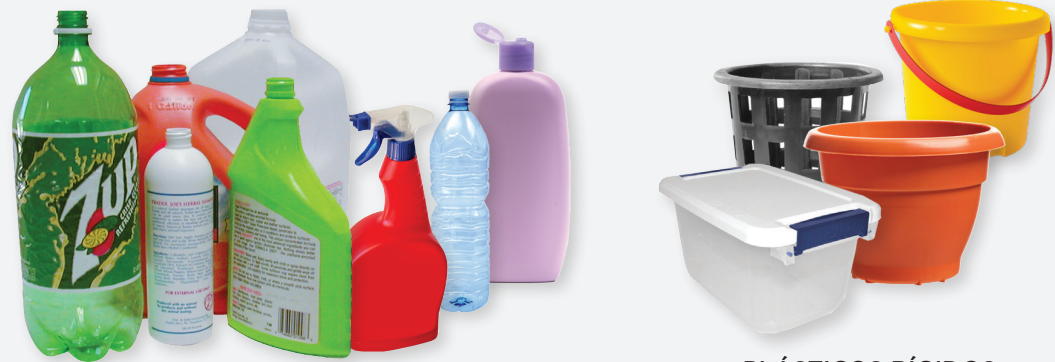
TODAS LAS BOTELLAS DE PLÁSTICO

Todos los artículos deben estar limpios, secos y sueltos (no en bolsas). Las botellas deben enjuagarse y vaciarse. Aplane las cajas de cartón. Vacíen las latas de aerosol. NO LÍQUIDOS - NO BOLSAS DE PLÁSTICO