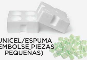
UNICEL/ESPUMA (EMBOLSE PIEZAS PEQUEÑAS)