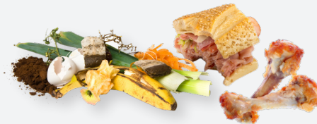
RESTOS DE COMIDA Y SOBRAS

NO ELECTRÓNICOS - NO RESIDUOS PELIGROSOS