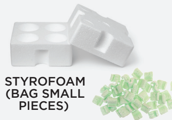
STYROFOAM (BAG SMALL PIECES)