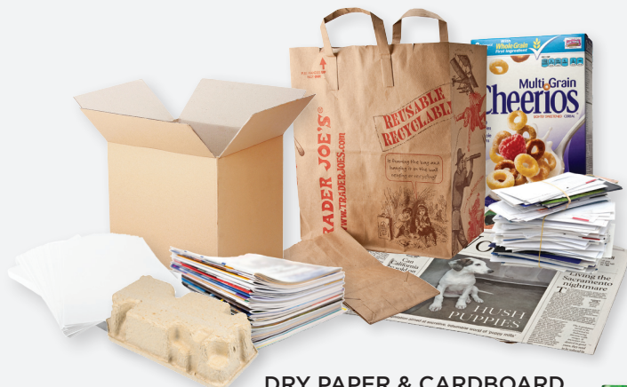
DRY PAPER & CARDBOARD