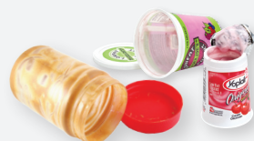
PLASTIC FOOD CONTAINERS