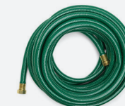
MANGUERA DE JARDÍN