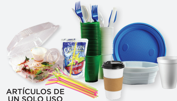
ARTÍCULOS DE UN SOLO USO