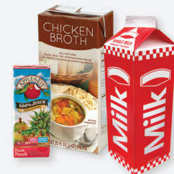
CARTONES Y CARTULINA ENCERADAS