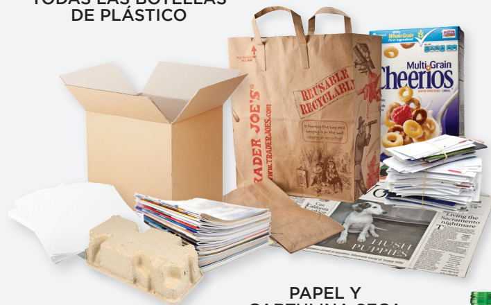
PAPEL Y CARTULINA SECA