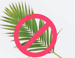
NO HOJAS DE PALMAS