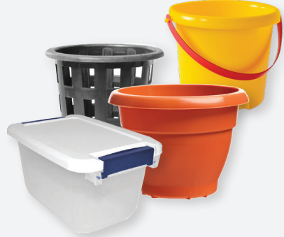
PLÁSTICOS RÍGIDOS MAYORES A 6"