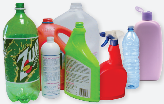
ALL PLASTIC BOTTLES

REDUCE FIRST, THEN REUSE, AND LASTLY RECYCLE. All items should be clean, dry, and loose (not bagged). Bottles should be rinsed out and emptied. Break down boxes. Empty aerosol cans. NO LIQUIDS - NO PLASTIC BAGS