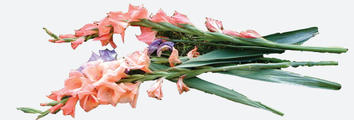
FLOWERS & PLANTS