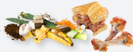
FOOD SCRAPS & LEFTOVERS

Reduce waste by prioritizing reusable and durable materials over single-use. Food and wet/soiled paper in the trash will be sorted out and turned into compost at the County's ReSource Center. NO ELECTRONICS - NO HAZARDOUS WASTE