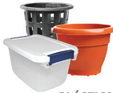
PLÁSTICOS RÍGIDOS DE MÁS DE 6"