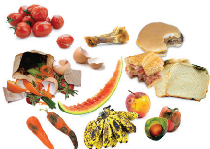
SOBRAS DE COMIDA

Estos desechos se harán abono en una instalación local y no irán al basurero.