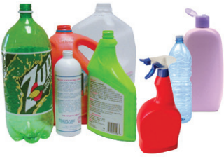
TODAS LAS BOTELLAS DE PLÁSTICO

Todos los artículos deberán estar limpios, secos y sueltos (no en bolsas). Las botellas deben estar limpias y vacías. Desarme las cajas. Vacíe los tubos de aerosol o spray.