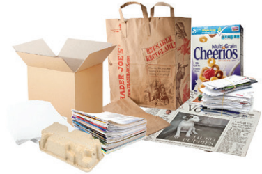
PAPEL SECO Y CARTÓN