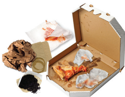
PAPEL MOJADO O SUCIO